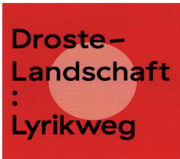
Zeichen Nr. 2: Rundwanderweg Hülshoff-Schleife