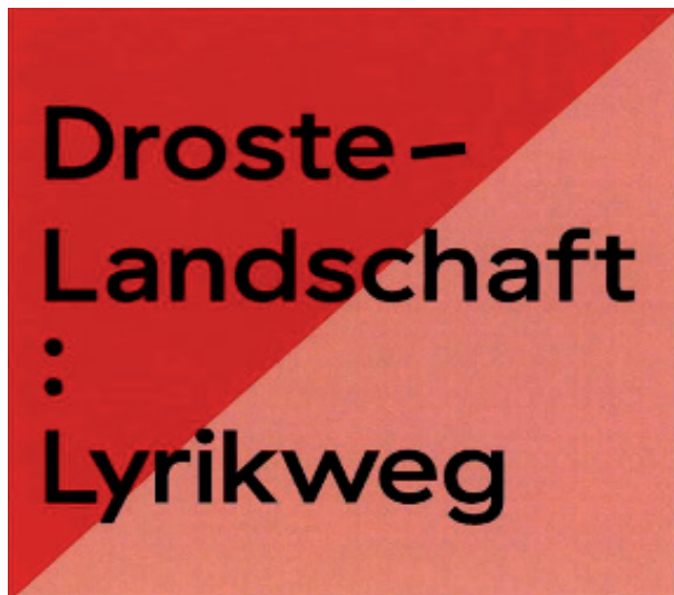
Zeichen Nr. 2: Rundwanderweg Hülshoff-Schleife