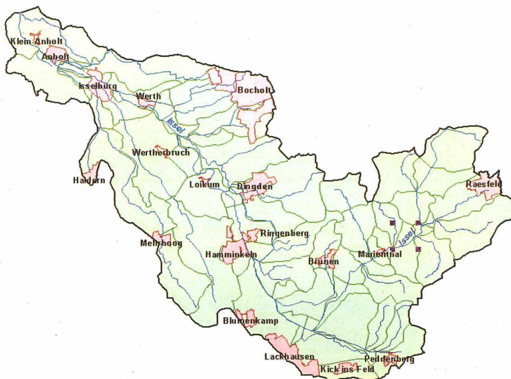
Abbildung 1: Gesamteinzugsgebiet Issel

Der Oberlauf bis ca. Marienthal ist ein kleiner Bach in einer hügeligen Landschaft. In Marienthal beginnt der flache Teil des Verlaufs, die wesentlichen Nebengewässer sind mit Winzelbach und Siegewinkelbach beigeflossen. Bei den meisten der im weiteren Verlauf zufließenden Gewässer ist ein rückstaufreier Zufluss nicht unter allen Umständen gewährleistet. Teilweise wird bei den Nebengewässern durch Klappen erreicht, dass die Issel im Hochwasserfall nicht in die Nebenläufe und Gräben hineinströmt, teilweise werden im weiteren Unterlauf Schöpfwerke zur gesicherten Entwässerung des Hinterlandes erforderlich. Im Bereich von Haus Esselt beginnt der "eingedeichte" Verlauf der Issel. Dieser erstreckt sich bis kurz vor die Ortslage Loikum. Hier tritt die Issel in die Loikumer Schleifen ein, in denen sie als leicht eingeschnittener Fluss eine geringere Hochwassergefahr darstellt. Auf der Höhe von Wertherbruch beginnt wieder die Fluss-Charakteristik mit Verwallungen, die sich bis zur niederländischen Grenze erstreckt. Dieser Teil der Issel ist durch geringe seitliche Zuflüsse gekennzeichnet. Parallel verlaufen linksseitig die Klev'sche Landwehr und der Wolfstrang, auf der rechten Seite die kleine Issel sowie die Alte Aa. Die Deiche der Issel stellen keinen Hochwasserschutz im hundertjährigen Hochwasserfall dar, sondern schützen lediglich das Ausufer bei kleineren Hochwasserereignissen (Sommerdeiche).